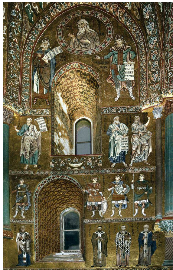
San Jorge. Mosaico del muro sur del coro de la catedral de Cefalù (Italia), c. 1145-1160.

http://iconreader.files.wordpress.com/2012/05/st_theodor_george_sina_i_9-10th_century.jpg [captura 31/05/2012]