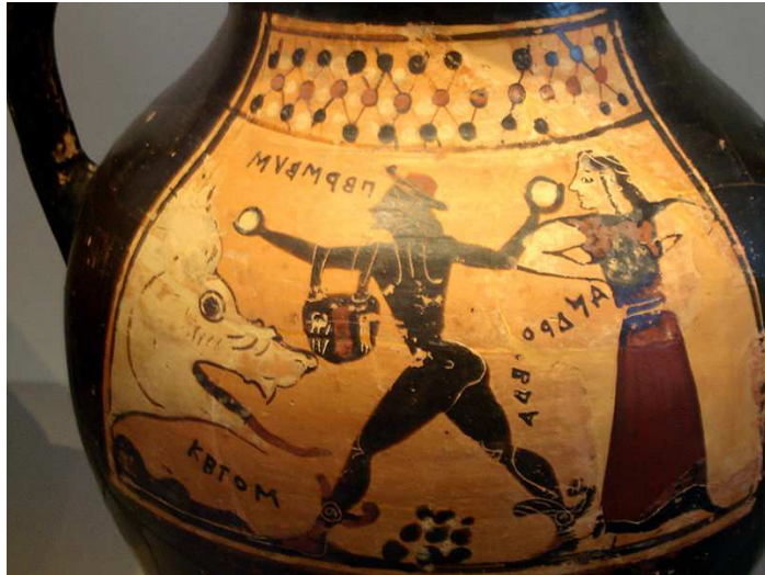
Perseo y Andrómeda. Vaso corintio, s. VII a.C. Berlín, Altes Museum.

http://commons.wikimedia.org/wiki/File:Corinthian_Vase_depicting_Perseus,_Andromeda_and_Ketos.jpg?uselang=es [captura 31/05/2012]