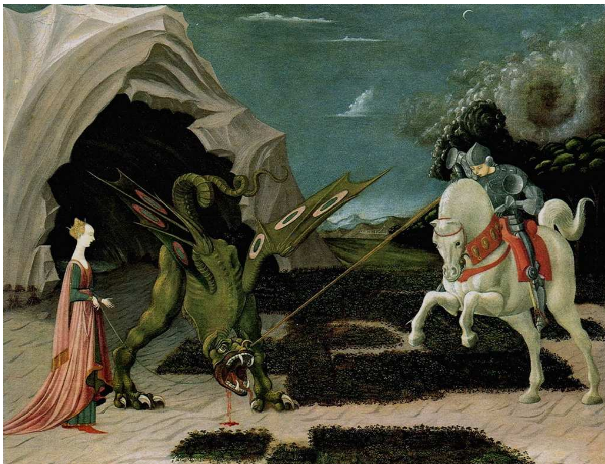
Paolo Uccello, San Jorge y el dragón , 1470, óleo sobre tabla. Londres, National Gallery.