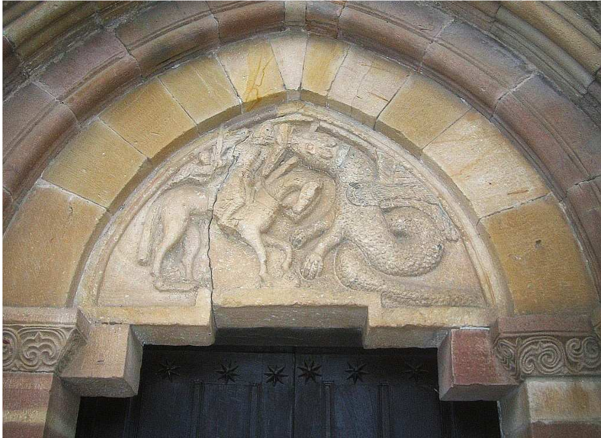
San Jorge y el dragón. Tímpano de Santa María de Yermo, Cantabria (España), siglo XIII.

http://es.wikipedia.org/wiki/Archivo:Santa_Maria_Yermo_04.jpg [captura 31/05/2012]