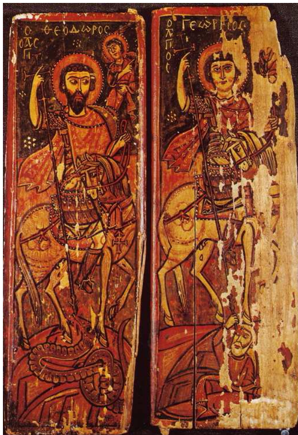
Icono de San Jorge y San Teodoro, siglos IX-X. Monasterio de Santa Catalina del Sinaí.

http://iconreader.files.wordpress.com/2012/05/st_theodor_george_sina_i_9-10th_century.jpg [captura 31/05/2012]