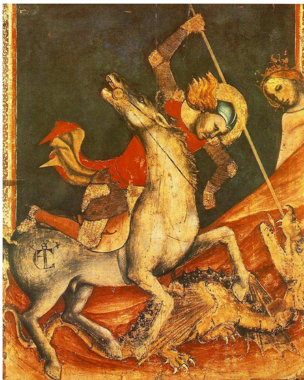
Vitale da Bologna, San Jorge y el dragón , 1350. Bolonia (Italia), Pinacoteca Nazionale.

http://es.wikipedia.org/wiki/Archivo:Santa_Maria_Yermo_04.jpg [captura 31/05/2012]