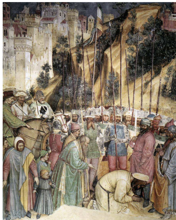
Altichiero da Zevio, La ejecución de San Jorge , c. 1380. Padua (Italia), oratorio de San Giorgio.

http://upload.wikimedia.org/wikipedia/commons/1/1b/VitaledaBologna.jpg [captura 31/05/2012]